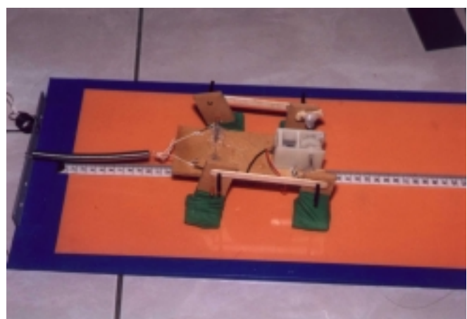
照片 3 拉力實驗