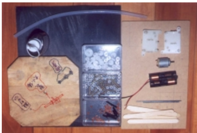
照片 1 做機器獸的材料