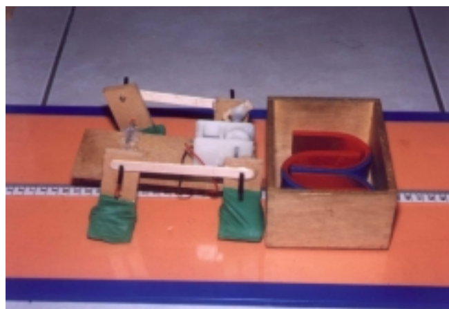
照片 4 推力實驗