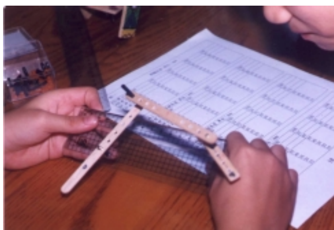
照片 5 操作四連桿模型