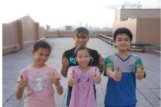
學校最美的風景在頂樓落水頭