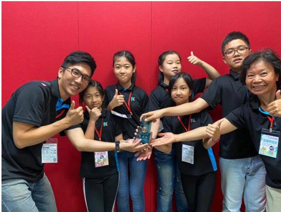
榮獲第 60 屆全國科展第一名