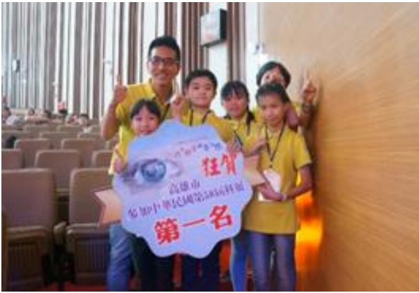
榮獲第 58 屆全國科展第一名

最後，感謝校長、學校的支持，感謝曾經協助過的專家、家長、參與的學生們，大家都是科展歷程不可缺少的重要螺絲釘，因為有你們科學才偉大。