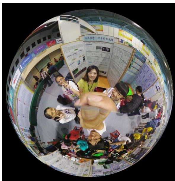
第 58 屆佈展後開心留影