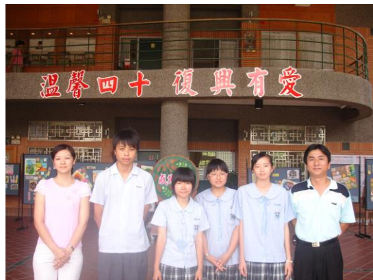
第 48 屆應用科第一名師生合影

研究佔用多數的課餘時間，為了實驗延續性常伴著星光回家…，但每個研究進展，總又能讓大家士氣大振，彷彿一切辛苦都有了代價，與學生們一股腦的傻勁與堅持，這就是指導科展的一大快樂。