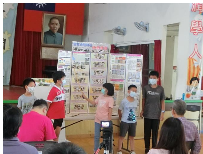
和家長分享研究成果，順便摹擬比賽複審報告