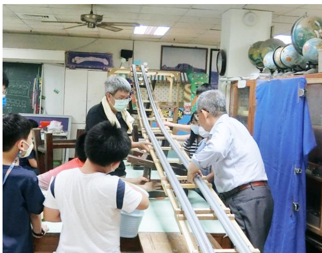
老師和孩子們一同製作實驗設備

回憶過往，歲歲月月年年，從開始進入「科展」領域到現在，讓我獲得最多的不是「獎狀」，而是實實在在的好朋友（老師、家長與孩子們），感謝有您！