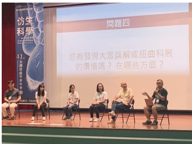
科展，讓內向的孩子勇敢在座談會上發表

「謝謝老師，讓我們曾經那樣認真的呼吸」，學生畢業時的感言。科展，是充滿衝突的長期活動，累到整個不行，卻又感動到不想放棄。這幾年，幸運的是，我們有了一個很棒的主任(餵食學生及假日關心)，與情同家人的社團同事(彼此支持與討論研究方向)，由衷的感謝這幾年一起寫故事的孩子，感謝你們在我們教書生涯所帶來的珍貴回憶，他們讓我們相信，這個島嶼充滿希望的無限可能，也更加期待未來台灣的美好。科展，不只是科學夢而已，而是一起走過的夢想與回憶旅程。