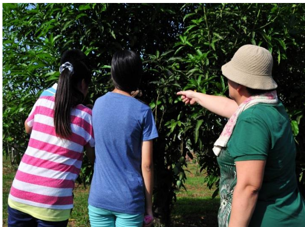
科展，開啟新視界。農委會專家指導

這是發生在這個城市的故事，一幕幕鮮明地仿如昨日。成為一個教育工作者，從沒想過會踏入科展這領域。直到學校同事出現，那年，他導師班上有個熱愛動物的學生，希望能帶他做做研究，就這樣，那位同事與學生，成為了教書之外熱情的催化劑。摸索幾年後，在一年的科展會場，遇到這個城市的科展前輩，那位主任鼓勵與分享科展進行的思考點。