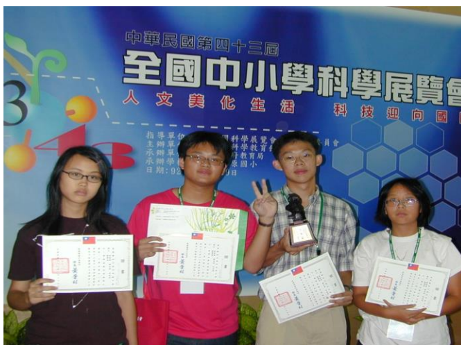
43 屆科展的部分學生持續資訊科學研究 已經是資訊工程博士候選人

還記得剛上研究所時，所長在新生座談會上說過一句話，以前你們跟老師的關係是師生關係，從今天開始我們都是一起做研究的同事關係。當年所長這一句話給我不小的震撼，終於在人生追求學識的道路上可以跟很多學識淵博的人當朋友、當同事、當夥伴，一起分享研究的道路上的酸甜苦辣。